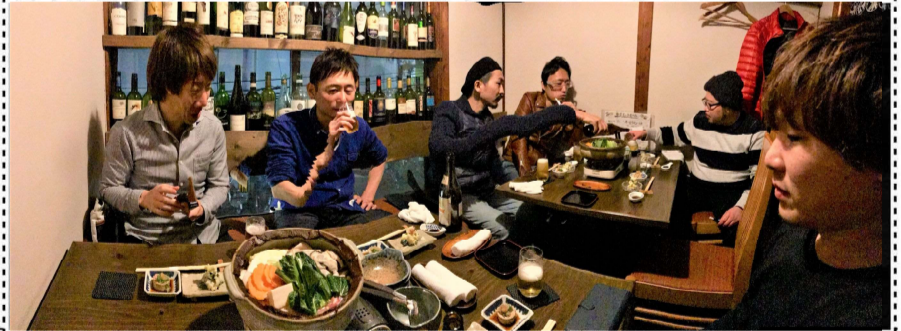
青年部新年会を 1 月 28 日 (月) 流川の「まめひと」にて行いました。

今回の災害で、大屋川流域は避難中に亡くなられた方が多く、背戸川流域は自宅に残って亡くなられた方が多い。日頃から今の住居・店舗がどんな場所に建っているのか、いち早く異常を察知する警戒心が求められる。