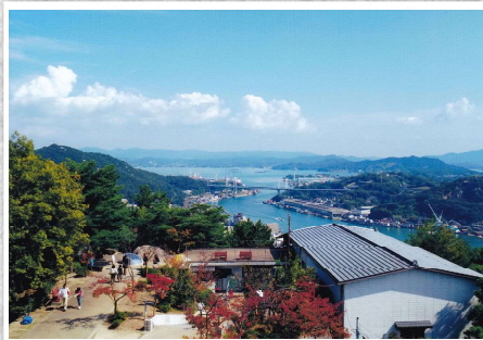
「尾道 千光寺公園」(写真)