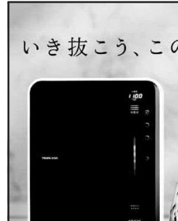
(文化広報部 深山 亮)