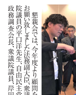
(文化広報部 深山 亮)