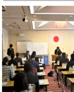
(文化広報部 深山 亮)